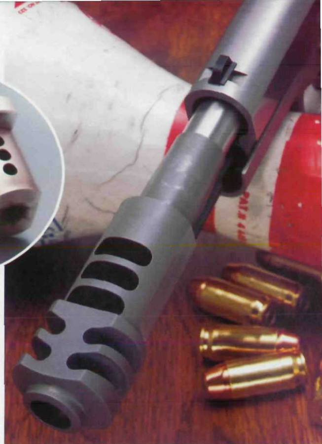
Think Big.-Der neu konstruierte Wolf-Comp bietet nicht nur effektive Rückstoßdämpfung sondern auch ein spektakuläres Erscheinungsbild.

daß möglichst der gesamte Gasschwall durch die Entlastungsbohrungen austritt. Die zweite Art den Gasschwall zur Rückstoßdämpfung zu nutzen ist die Gase nach Mündungsaustritt in Expansionskammern mit Prallflächen umzuleiten. Dazu müssen Vorrichtungen vor dem Lauf angebracht sein, in denen sich die Pulvergase erst ausbreiten können, dann gegen Prallflächen geleitet werden und schließlich durch Öffnungen in eine bestimmte Richtung abgeleitet werden. Während die Umleitung der Gase besser gegen das Hochschlagen der Waffe eingesetzt wird, sind die Expansionskammern mit ihren Prallflächen besser zur Reduzierung des Rückschlags geeignet. Moderne Kompensatoren, die hauptsächlich an Selbstlade-pistolen in den Action-Disziplinen eingesetzt werden, weisen sowohl Umlenkungsöffnungen als auch Expansionskammern auf, und können so leicht einer Pistole mit der Patronenenergie einer .357 Magnum das Rückstoßverhalten einer 9 mm Luger verleihen. Besonders für schnelle Schußfolgen auf ein oder mehrere Ziele ist nicht nur die Reduzierung des Hochschlags wichtig, der den Schützen zwingt,