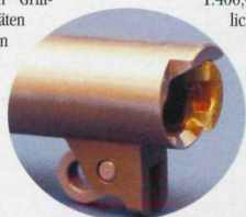
Gasdruck-Bändigung. An der aufgeschnittenen Hülse im Patronenlager sieht man, daß nur der massive Bodenteil der Hülse nicht mehr vom Patronenlager umschlossen wird.

die zuvor als Vergleich aus der unkompenstierten Serienwaffe verschossen wurden. Daß der Kompensator zwar das Rückstoßverhalten positiv beeinflusst, die enormen Rückstoßkräfte aber nicht vollständig ausgleichen kann, sieht man an dem Shok-Buff-Rückstoßpuffer, der am Ende der Federführungsstange den zurücklaufenden Schlitten abfängt, und im Fall der .460 Rowland schon nach 200 Schuß deutliche Spuren aufweist. Die mit 24 lbs. (1 lbs./ engl. Pfund = 453,6 Gramm) extrem starke Verschlussfeder (16-18,5 lbs sind Standard für die .45 ACP), stellt auch das Abzugssystem vor besondere Anforderungen, denn der Schlag, der beim Schließen des Schlittens durch die Waffe geht, kann schon mal den Hammer aus der Abzugsklinke in die Sicherheitsrast fallen lassen, oder sogar zum Doppeln führen. Zur Sicherheit sollte man nach einem Schließfederwechsel darum