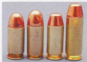
Die wichtigsten Vertreter der .45er-Pistolen-Patronen. (v.l.) .45 ACP, .451 Detonics Magnum, .460 Rowland und .45 Winchester Magnum

Text: Jens Tigges, Peter Dlsak